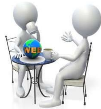
Informeel draagvlak creëren

In die fase zal ook de projectmatige concretisering via een projectplan, of voor de PRINCE2-ers onder ons het Projectinitiatiedocument, plaatsvinden. Niet alleen als document maar als afstemmingsproces opnieuw een actie waar communicatie “met de hoofdletter C” gewenst is om een gezamenlijk kader te bewerkstelligen. Communicatie in formele maar zeker ook in informele zin is in deze fase cruciaal om uiteindelijk de handen op elkaar te krijgen. Door met belangrijke managers en hun beïnvloeders, zoals elke organisatie die wel kent, over het voorstel te spreken is enthousiasme te creëren, en zijn eventuele vraagtekens/zorgen bij het voorstel weg te nemen. Zo ontstaat een breed draagvlak en een grotere kans op een “GO” beslissing.