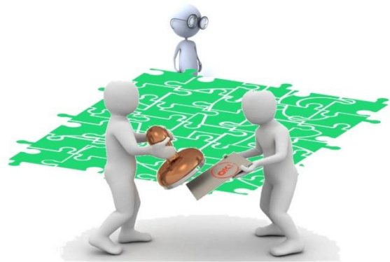
1d Data is nu echt ok!