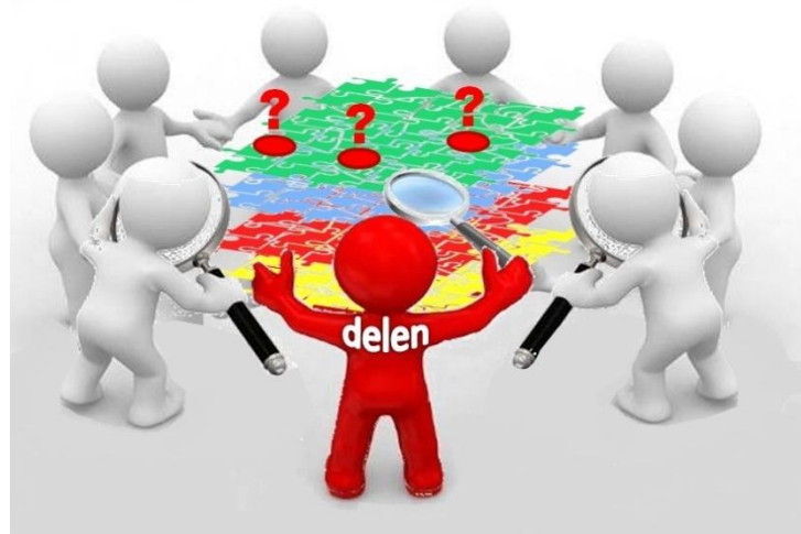
1b Data delen en onderzoeken