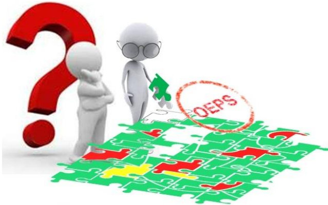
1c Data blijkt minder ok....Discrepancies wegwerken