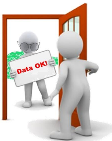
1a Mijn data is ok!

Mede ingegeven door de open data wens om informatie te delen en de verhoogde (externe) eisen, investeren veel organisaties momenteel veel tijd en geld in datakwaliteit-trajecten. Een interessant fenomeen daarbij vormen de natuurlijke barrières die daarbij vaak te doorbreken zijn bij de eigenaren van de data. Voortbordurend op het eerdere voorbeeld is het voorstelbaar dat het team met de niet 100% betrouwbare dataset, naar de buitenwacht het beeld overeind houdt dat zij hun gegevens prima op orde hebben. Door de gegevens breder beschikbaar te gaan stellen, en in dat proces deze te relateren aan (of in dit geval beter, te confronteren met) andere gegevens valt dat positieve beeld vaak plots in duigen...Logisch dat er niet door iedereen van harte mee zal willen werken. Vanuit het belang van de organisatie geredeneerd, is deze wetenschap juist een extra motivatie om in te zetten op het verbinden van gegevensverzamelingen. Door de discrepanties die daarbij ontstaan inzichtelijk te maken is een belangrijke kwaliteitsslag te maken.